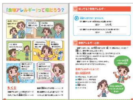
『食物アレルギー』って何だろう？』の頁