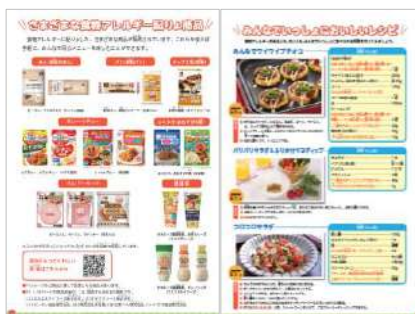
『さまざまな食物アレルギー配慮商品』の頁

同年代のキャラクターが登場し、マンガやイラストを交えてわかりやすく解説する内容は、好評をいただいています。