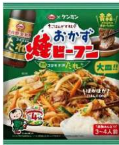
おかず焼ビーフンスタミナ源たれ味