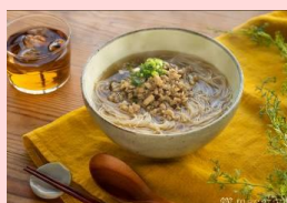
1位：台湾屋台風汁ビーフン 6,595 票