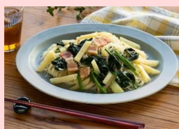
2位：焼ビーフン塩バター風味 5,162 票