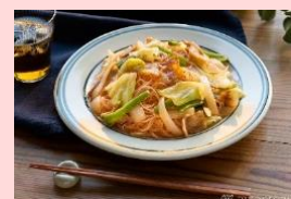
3位：焼ビーフン完熟トマト 3,494 票