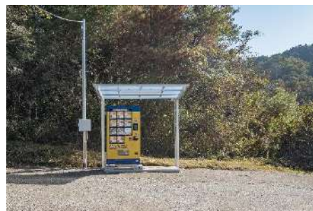
駐車場入って正面に自動販売機