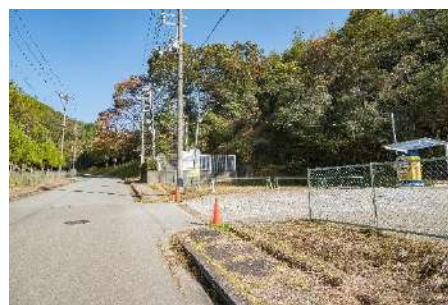
工場入口手前にある駐車場