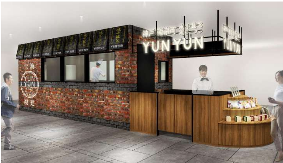
YUNYUN ルクア大阪店のイメージ

今回の出店に伴い、YUNYUNでは今後より一層、ケンミン食品のアンテナショップとしてビーフンをはじめとするアジアの優れた食と食文化を発信してまいります。