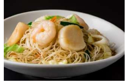
■ □ 海鮮焼ビーフン □ ■ 741円(税抜)

創業以来伝統の味。米だけでつくられた自社製のビーフンの香ばしさと旨味が特徴の逸品。注文ごとに鉄板で炒め、焼き立ての香ばしい香りとともにご賞味ください。