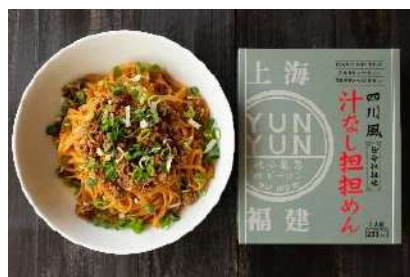
汁なし担担めんを完全再現！ おうちで YUNYUN の味を楽しめる 「汁なし担担めん」 1箱 1人前 300円(税抜)