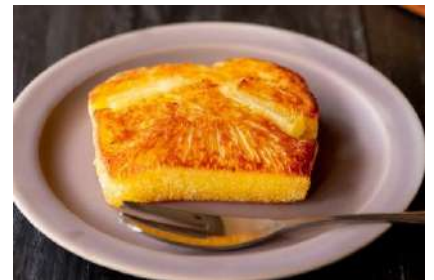
■ □ 鳳梨黄金もち □ ■ ひと切れ 186円(税抜)

台湾名物「魯肉飯」、特製たれで甘辛く炊いた豚肉をのせた台湾小食。粗く大き目の豚肉に少し濃いめの味付けで、白いご飯がすすみます！自家製煮玉子を添えて。