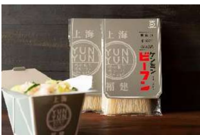
人気メニュー福建焼ビーフンで使用！ ケンミン食品のこだわりが詰まった 「お米 100%ビーフン」 150g(2~3人前) 250円(税抜)

YUNYUN の代表メニュー「福建焼ビーフン」で使用されているこだわりのお米 100%ビーフンや、人気メニュー「汁なし担担めん」を完全再現できる味付けソースと米めんのセットなど、YUNYUN オリジナルパッケージの商品を多数展開いたしております。