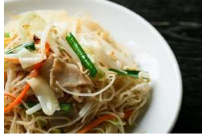
■ □ 福建焼ビーフン □ ■ 417円(税抜)

モチツとした生地をカリッと香ばしく焼いた皮の中から熱々の肉汁スープがジュワッと飛び出す、当店特製の焼小籠包。スープは7時間煮込んだ秘伝の上湯スープ、餡は国産豚のみであまい旨味が自慢です。