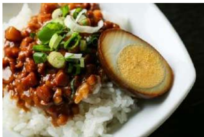
■ □ 台湾魯肉飯(ルーローハン) □ ■ 417円(税抜)

KARA-1 グランプリ第2位受賞作品。胡麻香るコクと甘みの濃厚担担ソースと、もっちりもちの米めんが相性抜群の一品です。当店の隠れた人気商品。