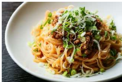
■ □ 汁なし担担めん □ ■ 417円(税抜)

看板メニューの福建焼ビーフンをベースに、中華の王道の三鮮、海老・イカ・ホタテ貝柱とともに炒め、海鮮の風味が合い交わり、美味しさの深みが増す絶品ビーフン。