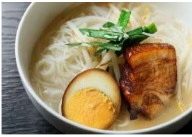
■ □ 角煮白湯ビーフン □ ■ 400 円 (税込)

10 時間以上煮込んだ豚骨と鶏がらベースの白湯スープと、自家製の塩だれのあっさりながらもコクの深いスープが自慢。しっかりと味をしみこませ煮込んだ角煮と煮玉子を添えています。