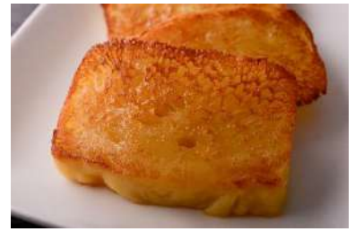
■ □ 黄金餅 (おうごんもち) □ ■ ひと切れ 150 円 (税込)

台湾名物「魯肉飯」、特製たれで甘辛く炊いた豚肉をのせた台湾小乞。白いご飯がすすみます！自家製煮玉子を添えて。