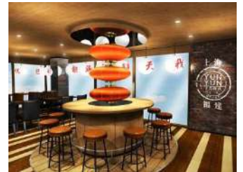
手包み・焼きたての実演