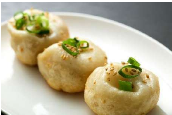
■□ 焼小籠包（上海生煎饅頭） □■