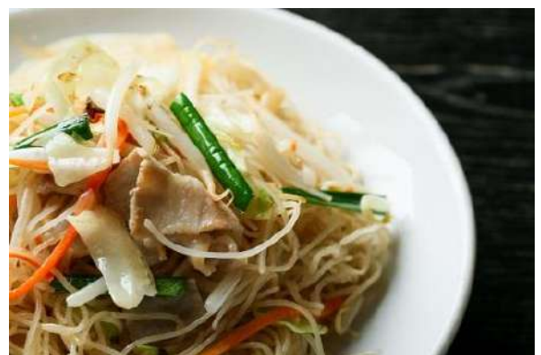
■□ 福建焼ビーフン □■

モチットした生地をカリッと香ばしく焼いた皮の中から熱々の肉汁スープがジュワッと飛び出す、当店特製の焼小籠包。店舗で丁寧に手包みし、大きな鉄板鍋で焼き上げます。ぜひ出来立てをお召し上がりください。