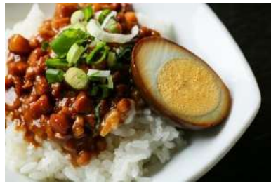
■ □ 魯肉飯 (ルーローハン) □ ■ 400 円 (税込)

10 時間以上煮込んだ豚骨と鶏がらベースの白湯スープと、自家製の塩だれのあっさりながらもコクの深いスープが自慢。しっかりと味をしみこませ煮込んだ角煮と煮玉子を添えています。